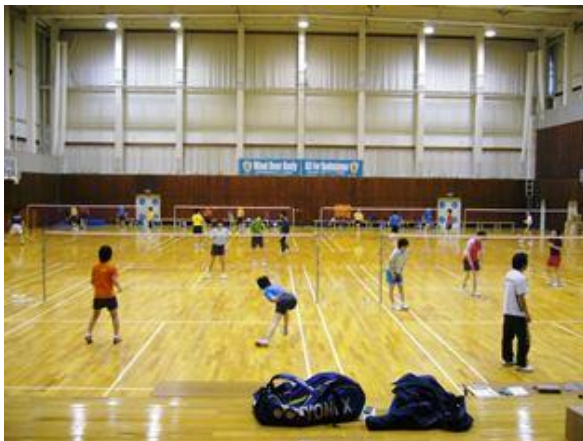
バドミントン練習