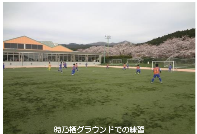
時乃栖グラウンドでの練習