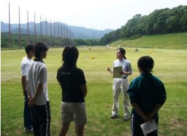
専任コーチによるゴルフの技術指導