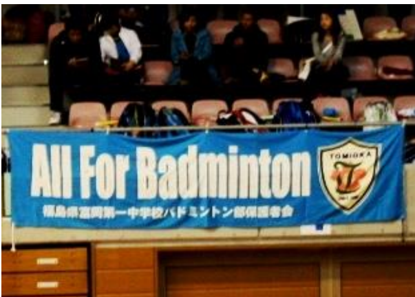
バドミントン（中学校）横断幕