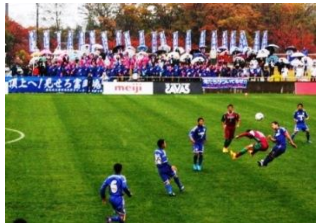
県版サッカー試合（男子）