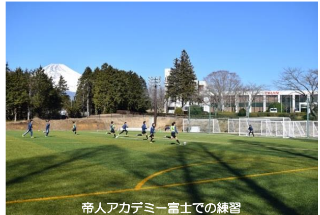
帝人アカデミー富士での練習

なお、中学生女子は、2016年度（平成28年度）から裾野市立富岡中学校に通学することとなった。