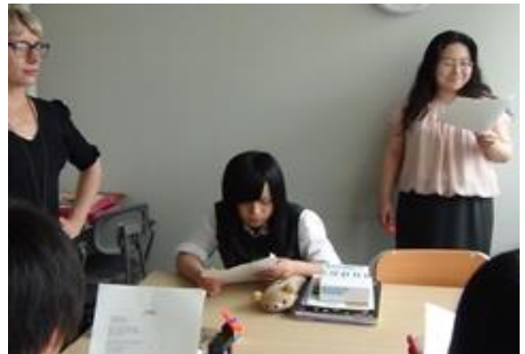
国際コミュニケーションコース授業