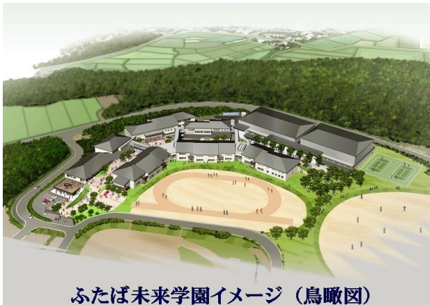
ふたば未来学園イメージ（鳥瞰図）