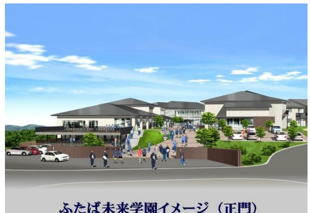
ふたば未来学園イメージ（正門）