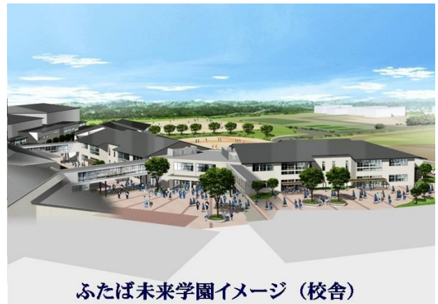
ふたば未来学園イメージ（校舎）