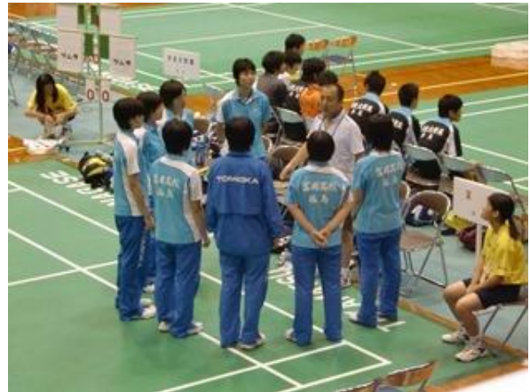
バドミントン試合