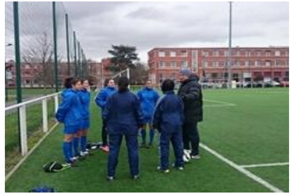
フランスサッカー交流