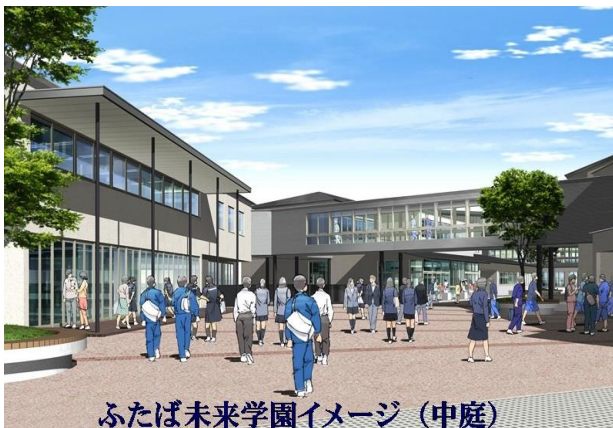
ふたば未来学園イメージ（中庭）