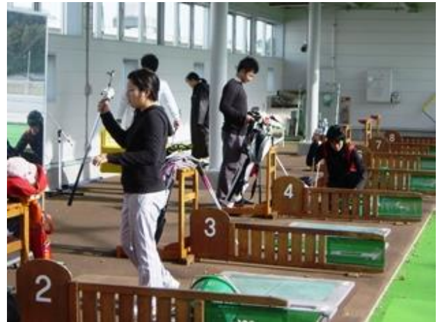
ゴルフ練習場でのトレーニング