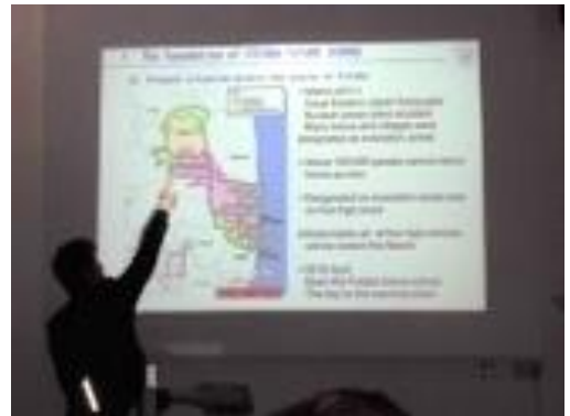
ドイツ連携校でのプレゼンテーションの様子