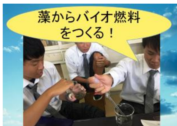
再生可能エネルギー探究班「藻で発電」に向けた実験