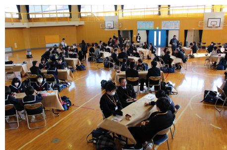
双葉郡子供未来会議の様子

今後は平成26年4月より「ふるさと創造学」として、ふるさとの伝統芸能や双葉郡のことを学校の中で考えていく授業もスタートします。浪江小学校等では、これまでもこうした取組が行われてきました。秋頃には再会の場として、みんなで集まりわたしたちのふるさとを共に考える機会を作ろうと企画しています。