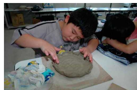
浪江町の「ふるさと浪江科」の学習の様子