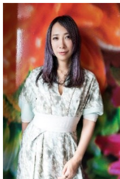
蜷川 実花 さん (写真家、映画監督)

木村伊兵衛写真賞ほか数々受賞。映画『さくらん』(2007)、『ヘルタースケルター』(2012)監督。映像作品も多く手がける。2008年、「蜷川実花展」が全国の美術館を巡回。2010年、Rizzoli N.Y.から写真集を出版、世界各国で話題に。2016年、台湾の現代美術館(MOCA Taipei)にて大規模な個展を開催し、同館の動員記録を大きく更新した。2020年東京オリンピック・パラリンピック競技大会組織委員会理事就任。 www.ninamika.com/