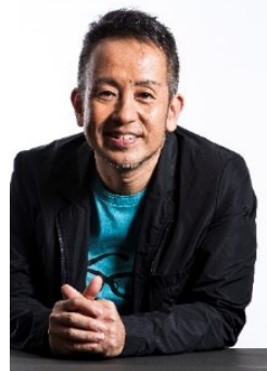
宮本 亜門 さん (演出家)

東京・銀座生まれ。2004年、ニューヨークのオン・ブロードウェイにて、東洋人初の演出家としてミュージカル「太平洋序曲」を上演。演劇界最高の栄誉であるトニー賞の4部門でノミネートを果たした。2005年に上演したミュージカル「Into The Woods」の演出で、朝日舞台芸術賞の秋元松代賞を受賞。2012年と2015年、AKBグループ内で主演のオーディションを申し選出した「ウイズ～オズの魔法使い～」を上演し、話題となる。2016年10月には、2020年東京五輪などに向けたキックオフイベント「スポーツ・文化・ワールド・フォーラム」の公式プログラム文化イベントに、鈴木亮平、市川海老蔵さんらの出演者、チームラボ、蜷川実花らとのクリエイティブチームとともに演出を手掛けた。また、世界で初めて能楽と3D映像を融合した「幽玄」をシンガポールにて世界初演。